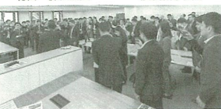
昨年12月に開設し、今年4月に開業した福岡支店。当日は取引先保険会社が駆けつけた